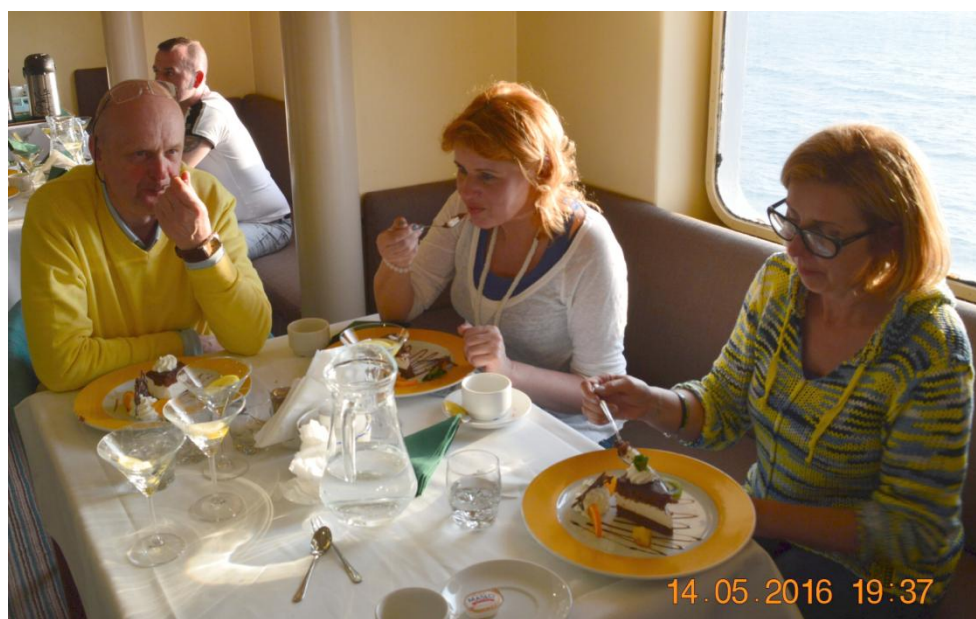
Port Nynäshamn, niedziela 15 maja 2016 godz. 12:20