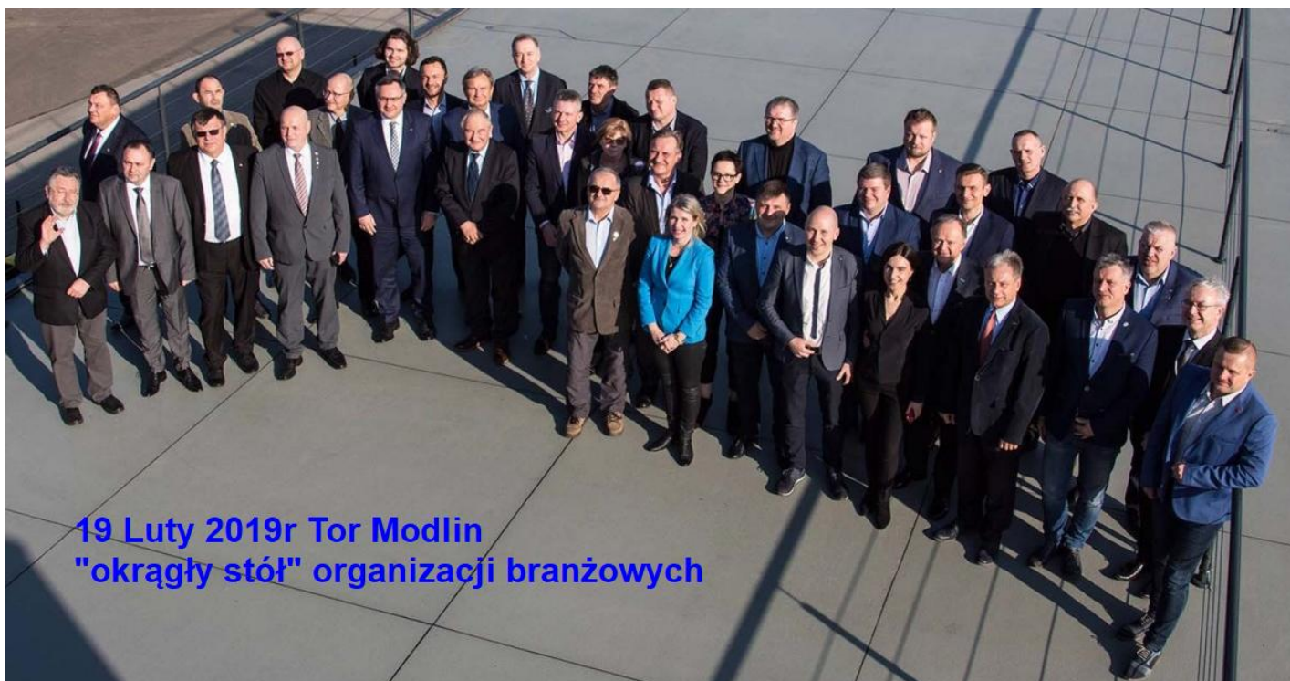
19 Luty 2019r Tor Modlin "okrągły stół" organizacji branżowych

To pierwsze spotkanie , które zgromadziło tak szerokie spektrum organizacji zrzeszających zarówno instruktorów, jak i egzaminatorów, pracowników administracji, przedsiębiorców oraz fundacje i stowarzyszenia posiadające jako cel statutowy zarówno działania na rzecz uczestników ruchu, jak i poprawę bezpieczeństwa na drogach. Obszerną relację opublikowano w Internecie, link