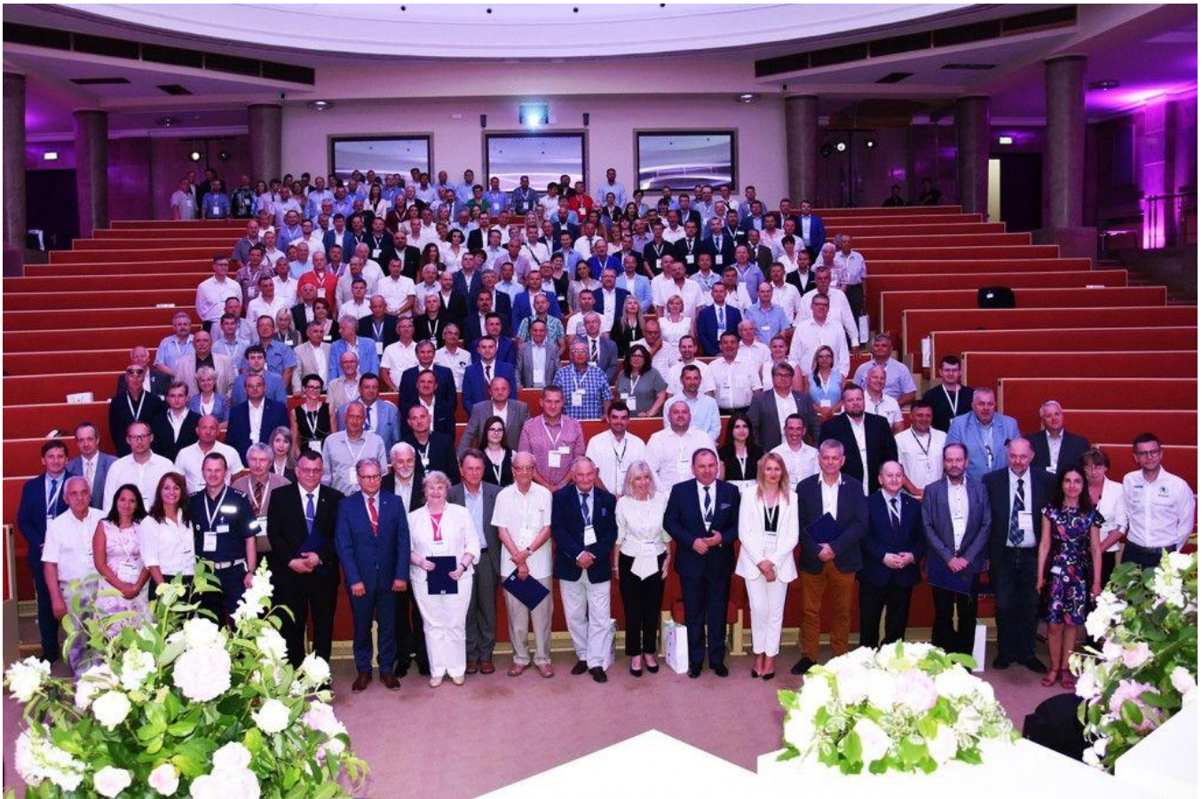
4) 9 lipca 2019 podczas obrad Senackiej Komisji Infrastruktury – przedstawiono informację o inicjatywie SZIE